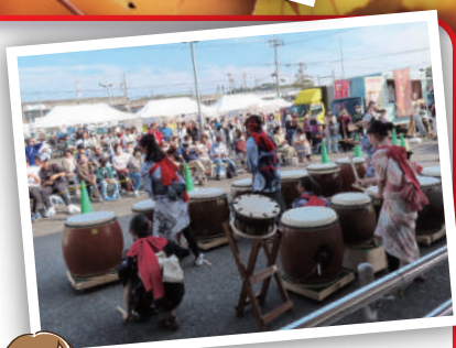
保見ふれあい祭り(昨年度)