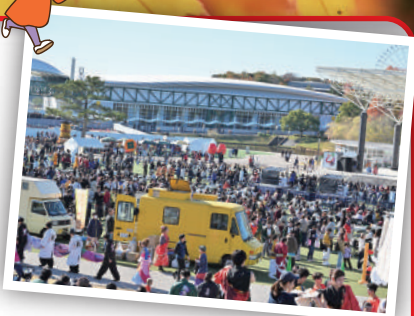
どまつりinモリコロパーク(昨年度)