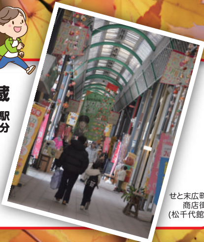
せと末広町商店街(松千代館)